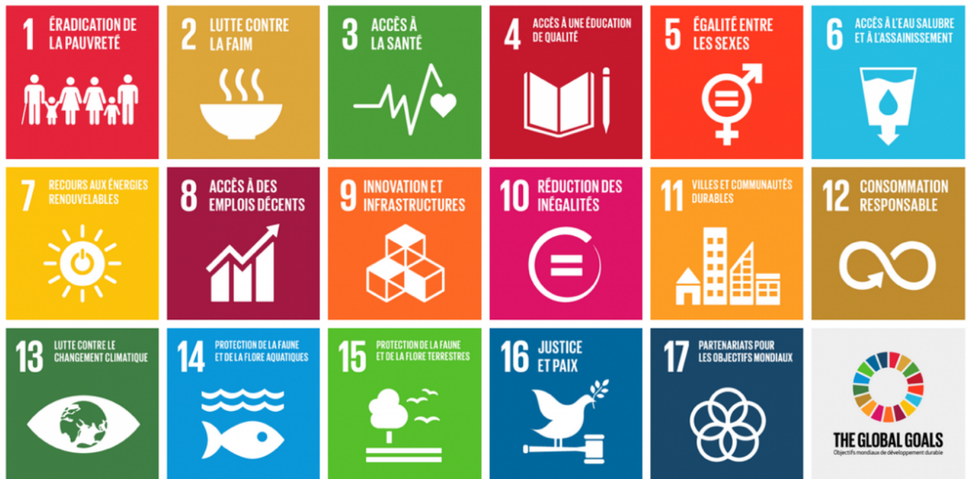
Les 17 Objectifs de développement durable (ODD)

Le niveau de l'aide au développement française est inférieur de moitié aux engagements pris. Mais c'est surtout sa tendance à la baisse qui est inquiétante.